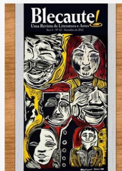
REVISTA BLECAUTE N 12