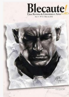
REVISTA BLECAUTE N 11