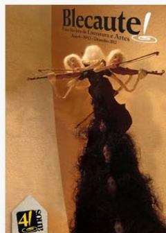
REVISTA BLECAUTE N 13